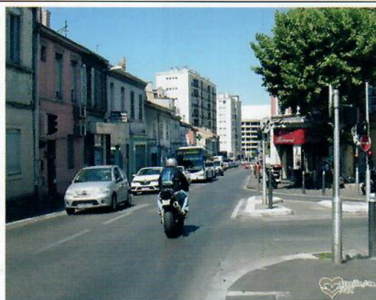
LE BAR DES PLATANES – Angle bd SAINTE MARGUERITE et bd Paul CLAUDEL