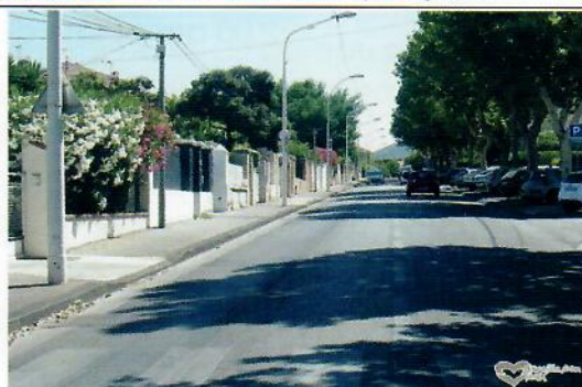
Le Boulevard GILLIBERT...