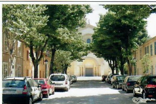
L'église SAINTE MARGUERITE...