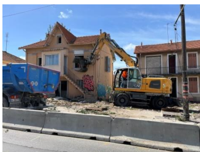
Destruction des habitations rue Augustin Aubert.