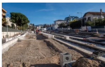
L'avenue Viton au début des travaux.