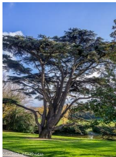
Cèdre du Liban

facile cette approche du parc botanique par tous. On ne va pas simplement se limiter à un étiquetage des différentes espèces représentées.