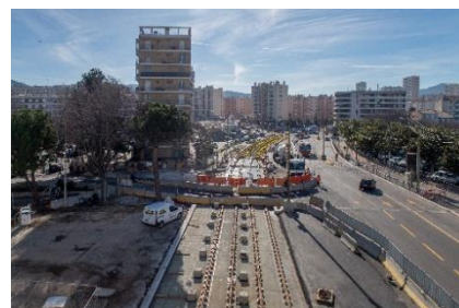
Vue de la station Dromel