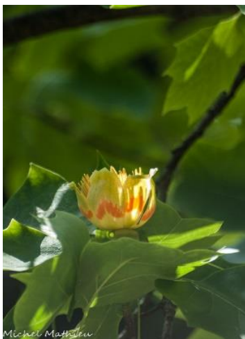
Tulipier de Virginie