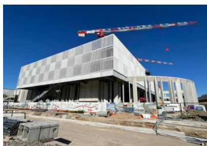
Le futur parking de 700 places.

La Métropole Aix-Marseille-Provence réalise actuellement les travaux d'extension du réseau de tramway nord/sud de Marseille afin de relier, au nord, Arenc à Capitaine Gèze et, au sud, la place Castellane à La Gaye. Objectif : mieux desservir les quartiers du nord au sud de Marseille et favoriser ainsi les déplacements en transports en commun. Ce projet prévoit également la création d'une piste cyclable bidirectionnelle continue entre Capitaine Gèze et La Gaye, permet de réaménager les lieux publics emblématiques de la ville et d'améliorer la qualité de vie des Marseillaises et des Marseillais en offrant une meilleure alternative à la voiture.