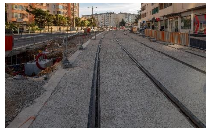
La rue Augustin Aubert avec les voies posées.