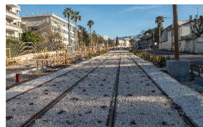
L'avenue Viton « terminée ».