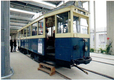
La rame standard 1930

23 janvier 1876 : Mise en service de la première ligne entre les Chartreux et la Joliette. Les voitures sont tractées par un équipage de 2 chevaux