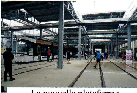
La nouvelle plateforme