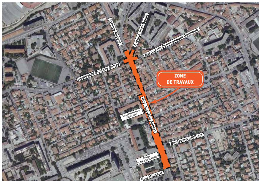
SCHÉMA DE REPÉRAGE

La 2 ème phase de travaux de voirie et d'aménagement urbain de la rue Augustin Aubert débutera à partir du vendredi 5 avril 2024. Elle s'achèvera en juillet 2024.